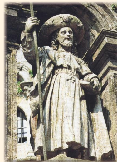
Vida del apóstol Santiago