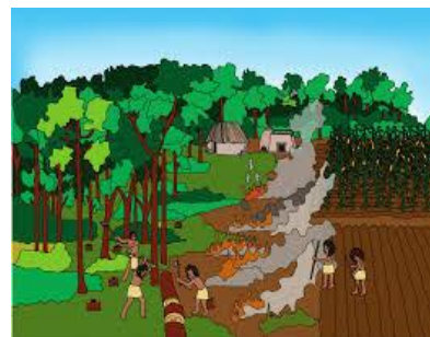
Sistema de roza maya